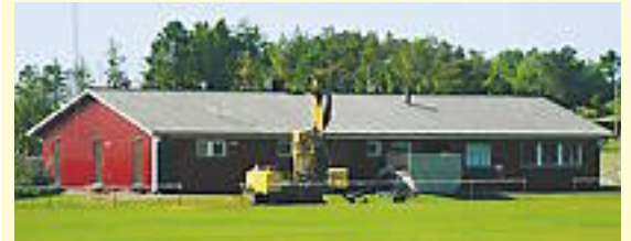
Tack vare Energifonden sponsrat av EoN kan fotbollsföreningar med egna anläggningar hjälpas att ställa om från direktverkande el till alternativa energikällor. Här borras det utanför Bua IF:s klubbhus.