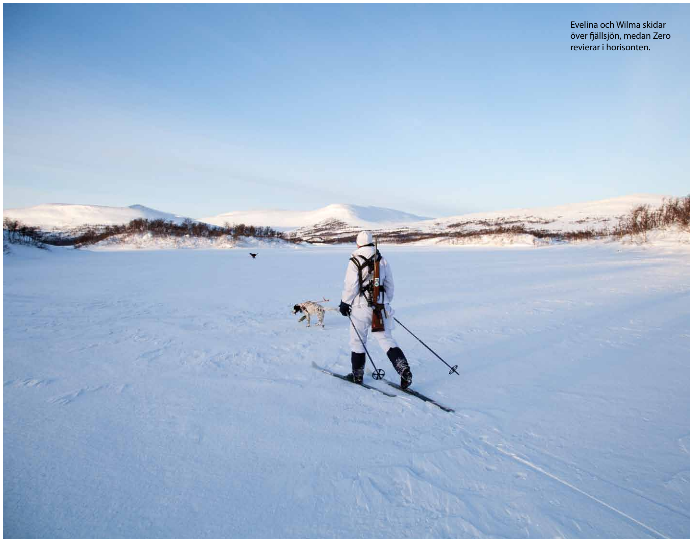
Evelina och Wilma skidar över fjällsjön, medan Zero revierar i horisonten.

positivt överraskade. Yoga är väldigt bra mental träning som är användbart bland annat när det gäller skytte.