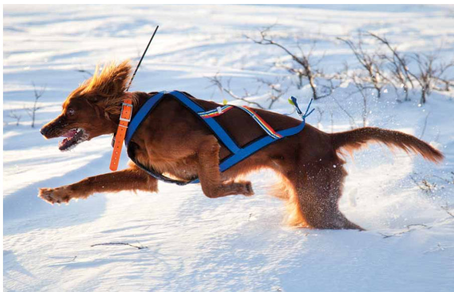
Shiva håller ett högt tempo i sitt sök.