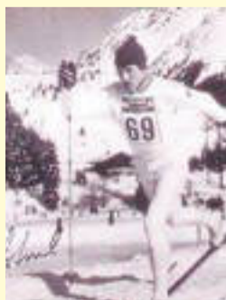
Evelinas pappa Lars-Göran Åslund tog VM guld i längdskidåkning (15 km) 1970.