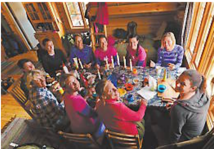
Vid frukostbordet är stämningen god och förväntningarna höga. Jaktlag ska bildas, strategier ritas upp. Bland tjejerna märks företagare, elitidrottare och "vanliga" tjejer med jaktintresse från hela landet.