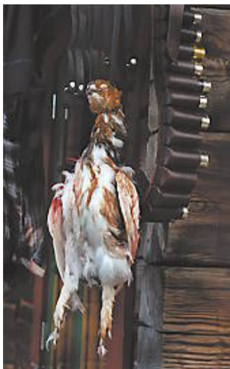
På stugdörren hänger ripan i väntan på att bli plockad och tillagad.

mycket god. Alla hjälps åt med att laga mat, elda, hämta vatten, tända bastun etc.