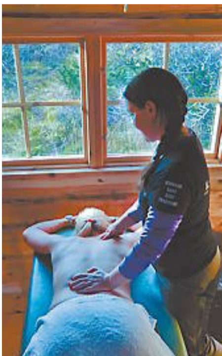
Efter en dag full av äventyr kan det vara skönt att avsluta med bastubad och massage